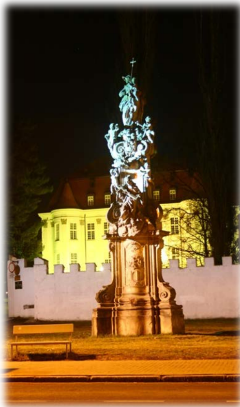
Zdjęcie konkursowe "Moje miasto nocą" - Grzegorz Łapeta