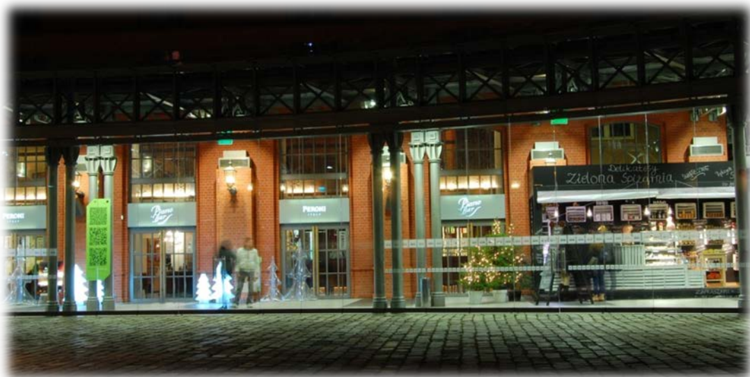
Zdjęcie konkursowe "Moje miasto nocą" - Małgorzata Smarowska