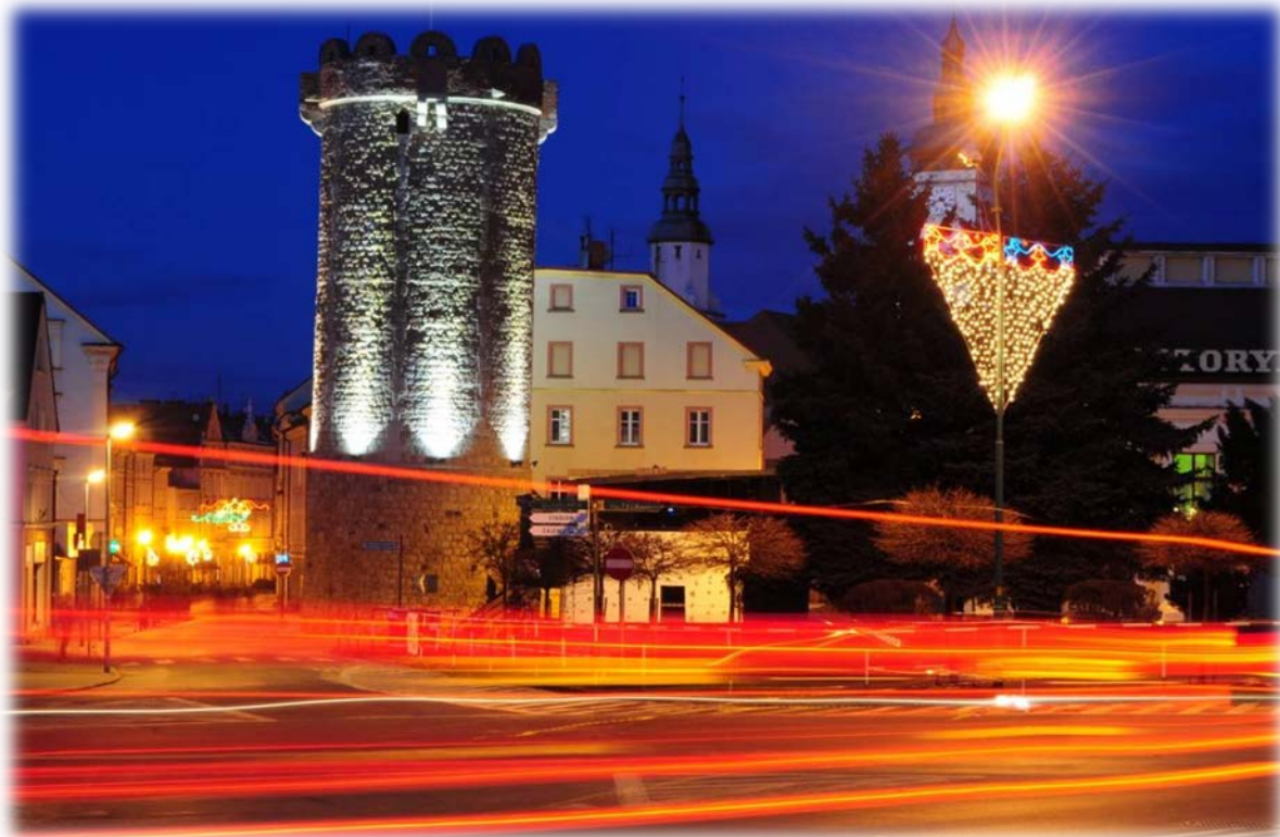
Zdjęcie konkursowe "Moje miasto nocą" - Mateusz Radecki

Przykładowe zdjęcia wykonane przez uczestników szkolenia dotychczasowych edycji.